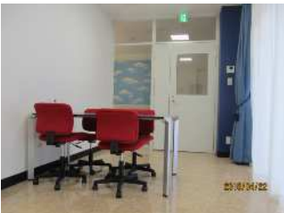
IC(インフォム・ネット)室