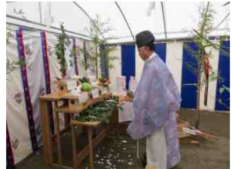
工事が始まりました