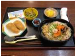
昼食の七夕そうめん

デイの活動としまして、7月に七夕の飾りつけを行いました。皆様、それぞれ短冊に願いをこ め、折り紙等で、たくさんの飾りを作りました。