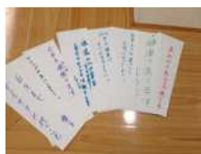
今年一年の抱負を短冊にしました！