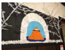
巨大“かまくら”が完成！

旧年を振り返ってみると、新しい出会いの多い1年でした。利用者様の年齢層も60歳台～100歳の方までと幅広くなり、よりにぎやかな場となりつつあります。今年も、利用者様の在宅生活がより長～く、より快適～♪に過ごせますように、機能訓練に特化した体操や個別リハの充実をはじめ、ケアマネージャーさん、主治医の先生等、他職種の方々とより一層ひとつの輪となっていきたいと思えます。今年も皆様にとって幸多き一年となりますように。今年もどうぞよろしく お願い致します。 順養の杜職員一同