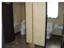
車椅子対応ゆったりトイレ増設