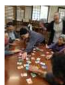
お正月らしく、福笑いとかかるたとり！