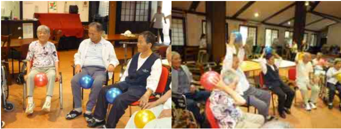
ボール体操を行っている様子

日々の生活がよりハツラツ！元気なものとなるよう、職員一丸となって支援させていただきます。