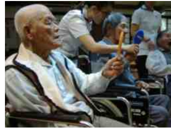
鏡を使った嚥下体操